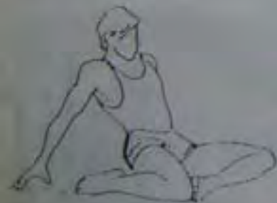
30 secondes chaque jambe