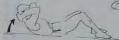
3 fois 5 secondes