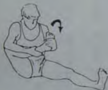
15 fois dans chaque sens