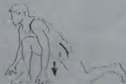
20 secondes chaque jambe