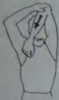
15 secondes chaque bras