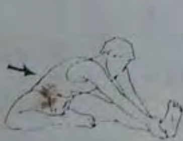
30 secondes chaque