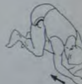
10 secondes chaque bras