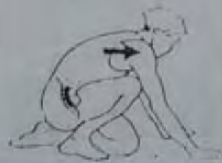
10 secondes chaque jambe