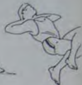
20 secondes de chaque côté