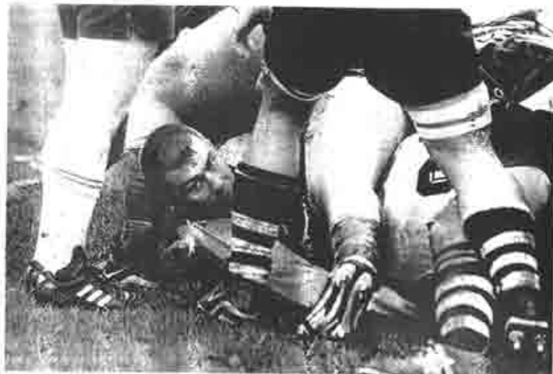
Un premier essai, fruit d'un travail collectif