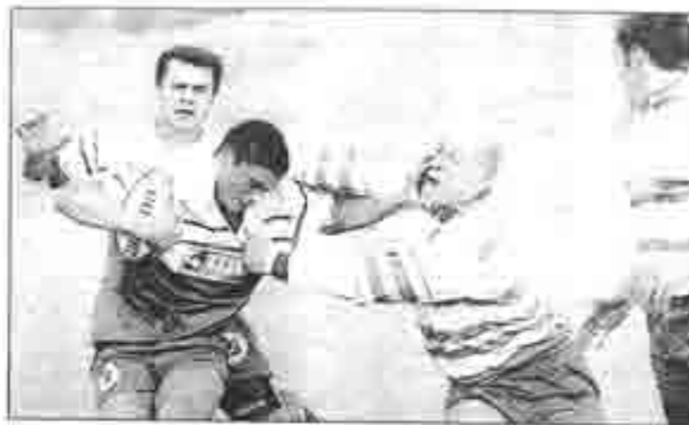
L'attaque jocondienne a élargi le jeu et fait courir les solides avants de Lagny. L'usure est arrivée naturellement.

Au contraire, Joué reprenait des mines, poussait Lagny à la faute et Dignac ouvrait la marque. Guiraudé perçait plein champ, flanqué de son ailier Prot, mais le retour à l'intérieur était fatal (23 e ). Joué dominait son sujet en jouant plus au large. Pris de vitesse, Lagny concédait des fautes dont une