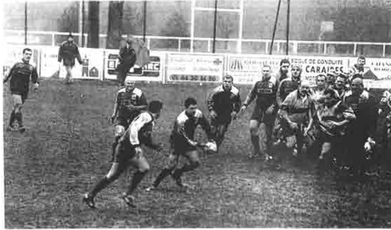
Lagny joue à la main malgré le terrain très gras