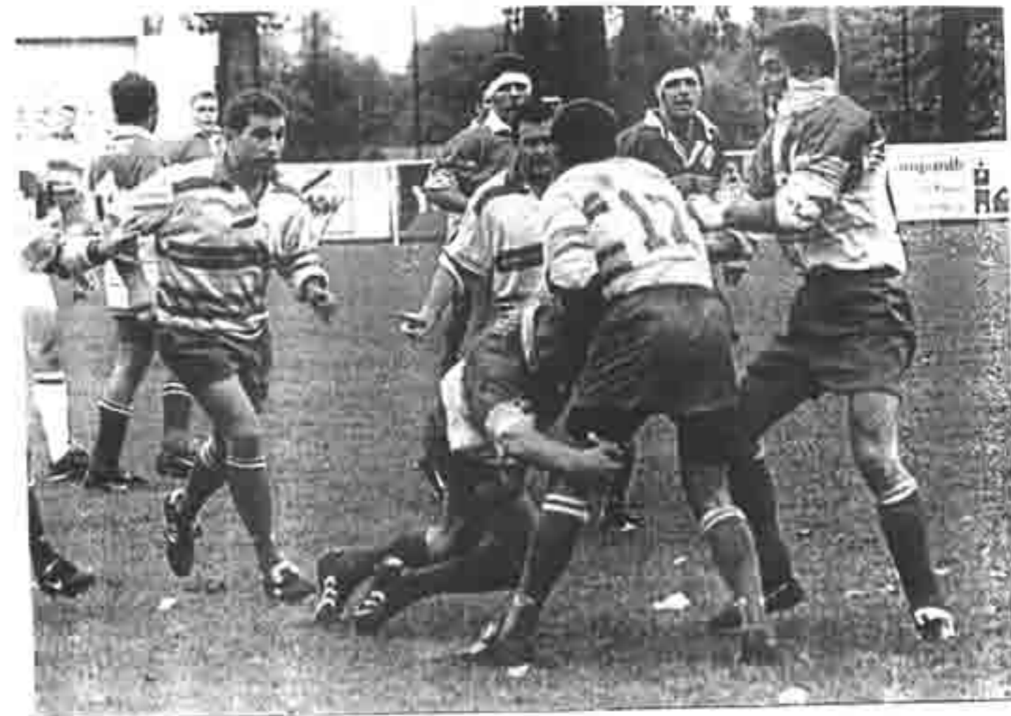
Lagny a cédé dans les arrêts de jeu