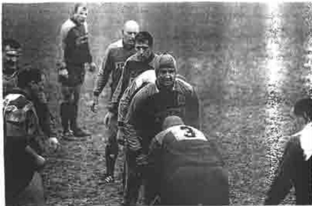
Le paquet a encore été à la hauteur

La deuxième période va être à sens unique pour une équipe de Lagny conquérante et surtout vigilante. Quelques petits coups de griffe vont sceller un match qui bascule dans l'escarcelle des visiteurs. Une belle victoire qui redonne le sourire à tout un groupe qui monte en pression au bon moment. Après des interrogations légitimes, les bleus ont semble-t-il trouvé leur rythme de croisière.