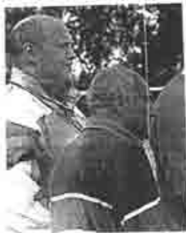
Les entraîneurs attentifs