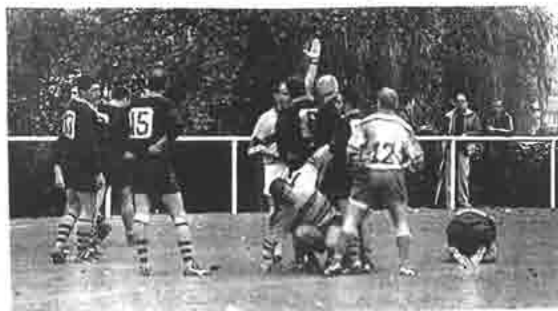
L'essai de la délivrance pour un accouchement difficile

Samedi 14 : Meaux-Melun/Combs au stade Taubert.