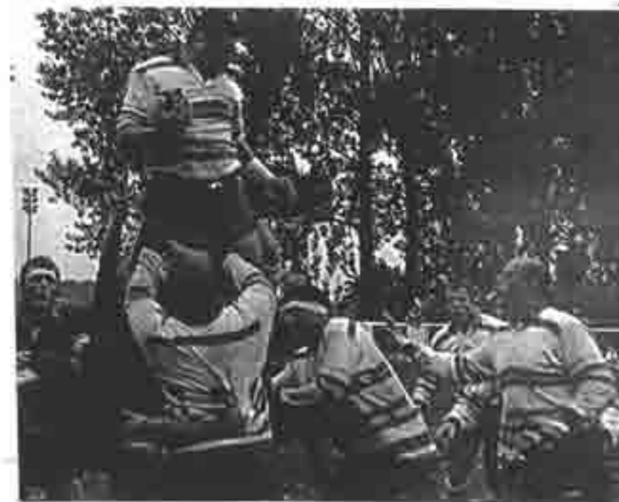
Une belle conquête en touche

En effet, Melun-Combs n'était encore mené que 6-3 à la pause. Score resté vierge jusqu'à dix minutes de la fin, malgré une occasion d'essai seine-et-marnaise manquée en début de seconde période. C'est alors que le vent a tourné. Lagny a pris un essai (13-3, 70') et un drop (16-3, 72') dans la foulée. Mais le match était déjà plié.