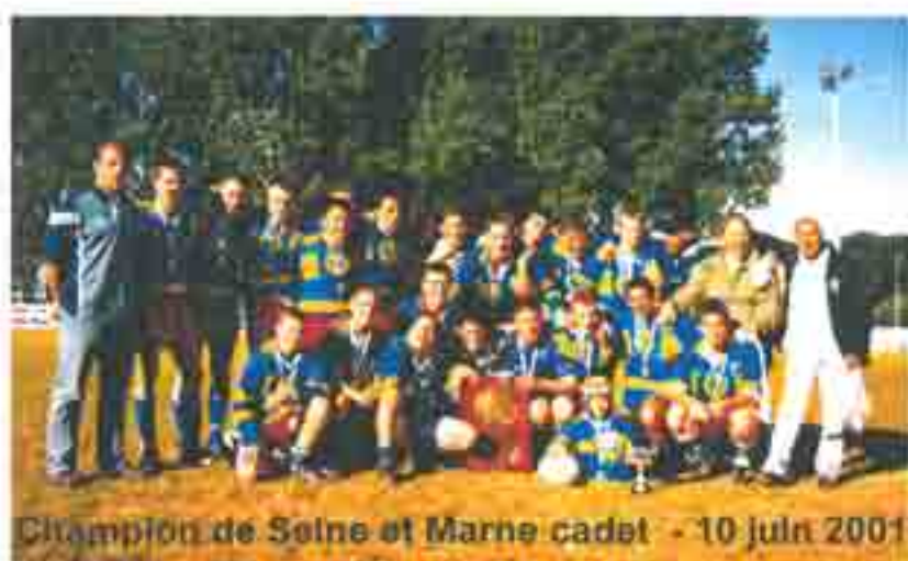
Champion de Seine et Marne cadet - 10 juin 2001