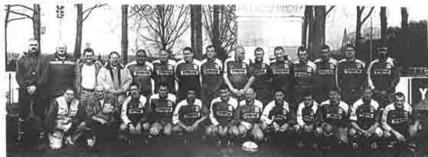
Photo de famille après la victoire dimanche. Le groupe a le sourire