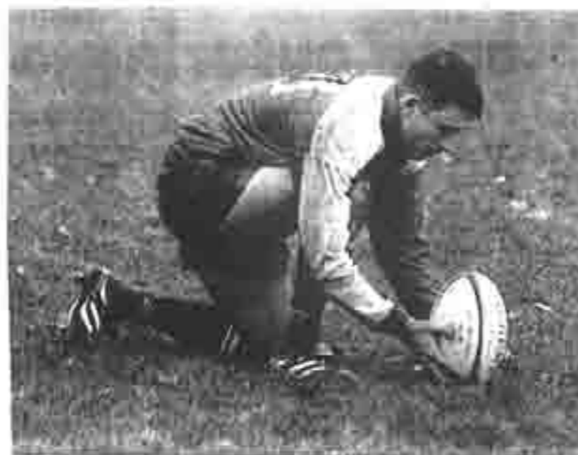
Essai transformé pour By

Deuxième victoire à l'extérieur. Actions en hausse.