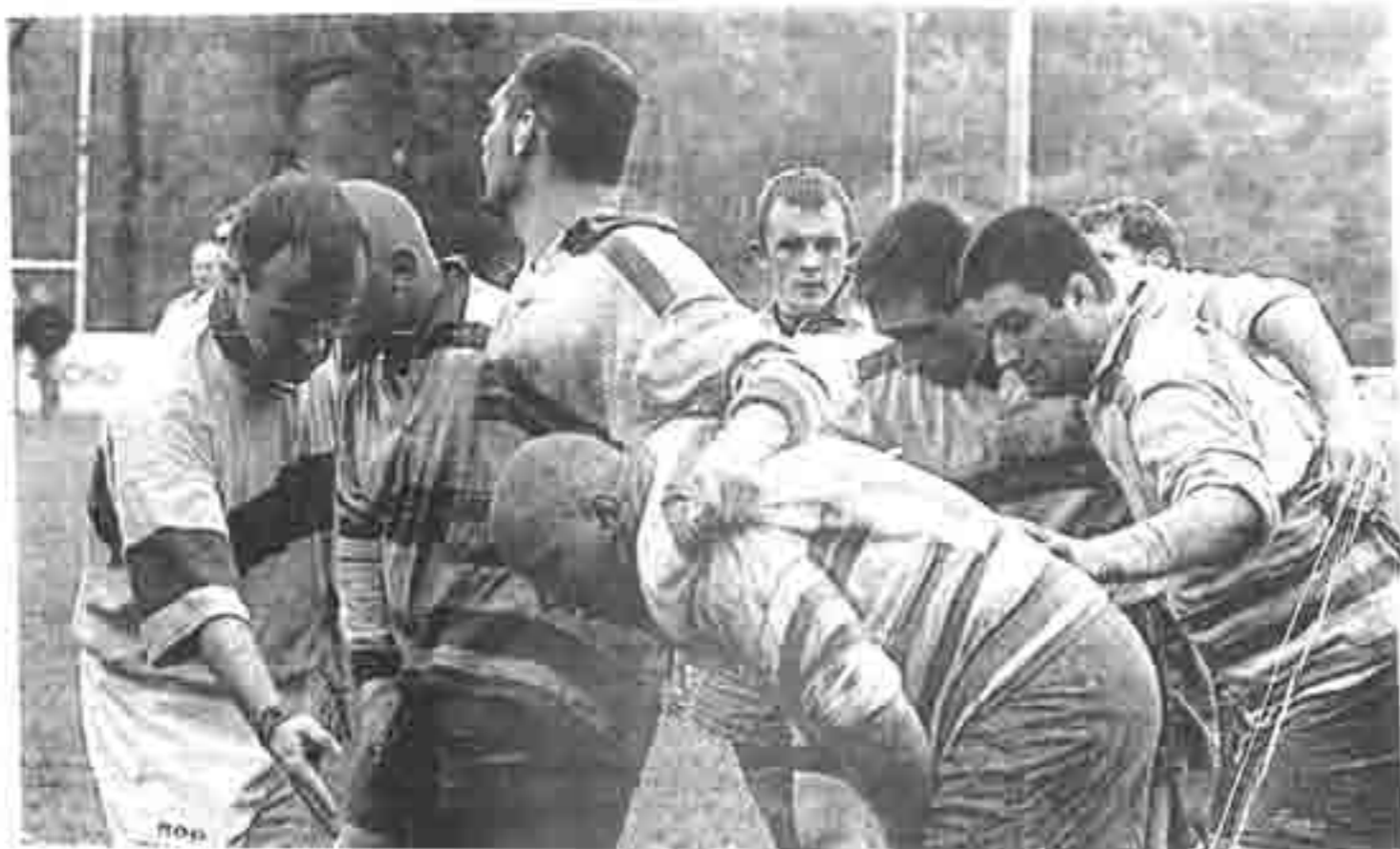
Le paquet a tenu la route