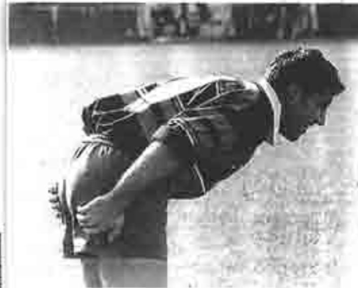
Martinez attend le cuir