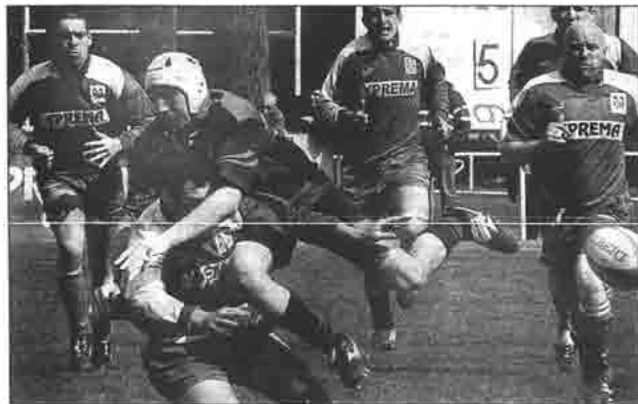
LAGNY-SUR-MARNE, DIMANCHE APRES-MIDI. Dans un match sans réel enjeu puisque la qualification pour la phase finale était dans la poche, la défense de Lagny a fait bonne garde pour permettre de remporter un succès confortable.