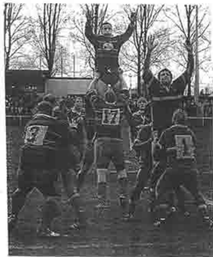
Lagny saute haut, mais souvent dans le mauvais tempo

La tension montait alors d'un cran et c'est finalement par des échafourées que les deux formations vont terminer cette première période, sur le score indécis de 8 à 5 en faveur de Lagny.