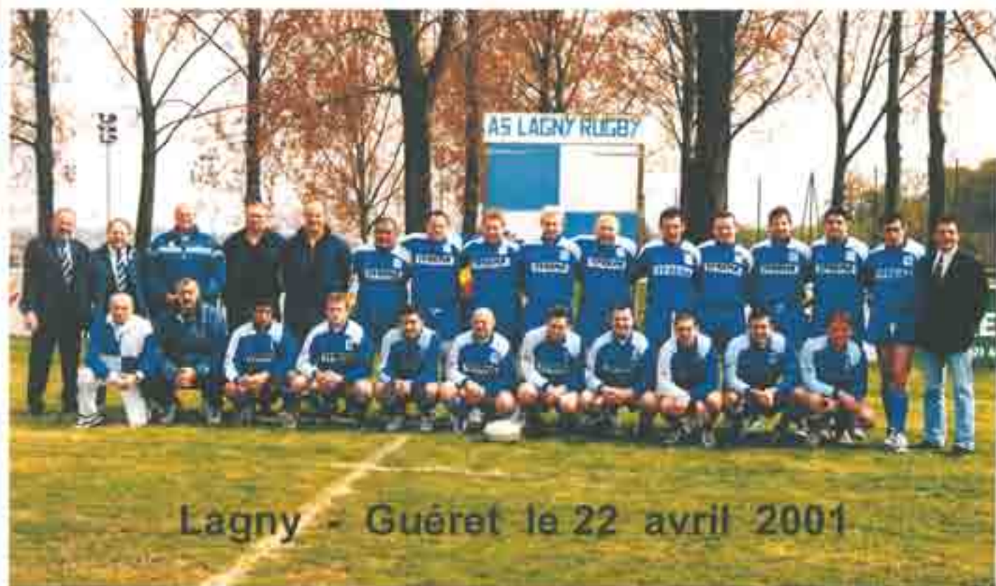
Lagny - Guéret le 22 avril 2001