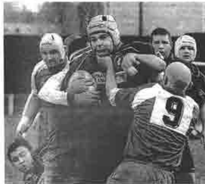
Les Guérétois ont été longtemps pris à la gorge par la solidité et l'agressivité de Lagny. (photo : Thomas JOUHANNAUD).

Tout restait à faire pour le RCG en deuxième mi-temps et, de surcroît, face au vent. Dans cette période souvent interrompue pour des bagarres isolées