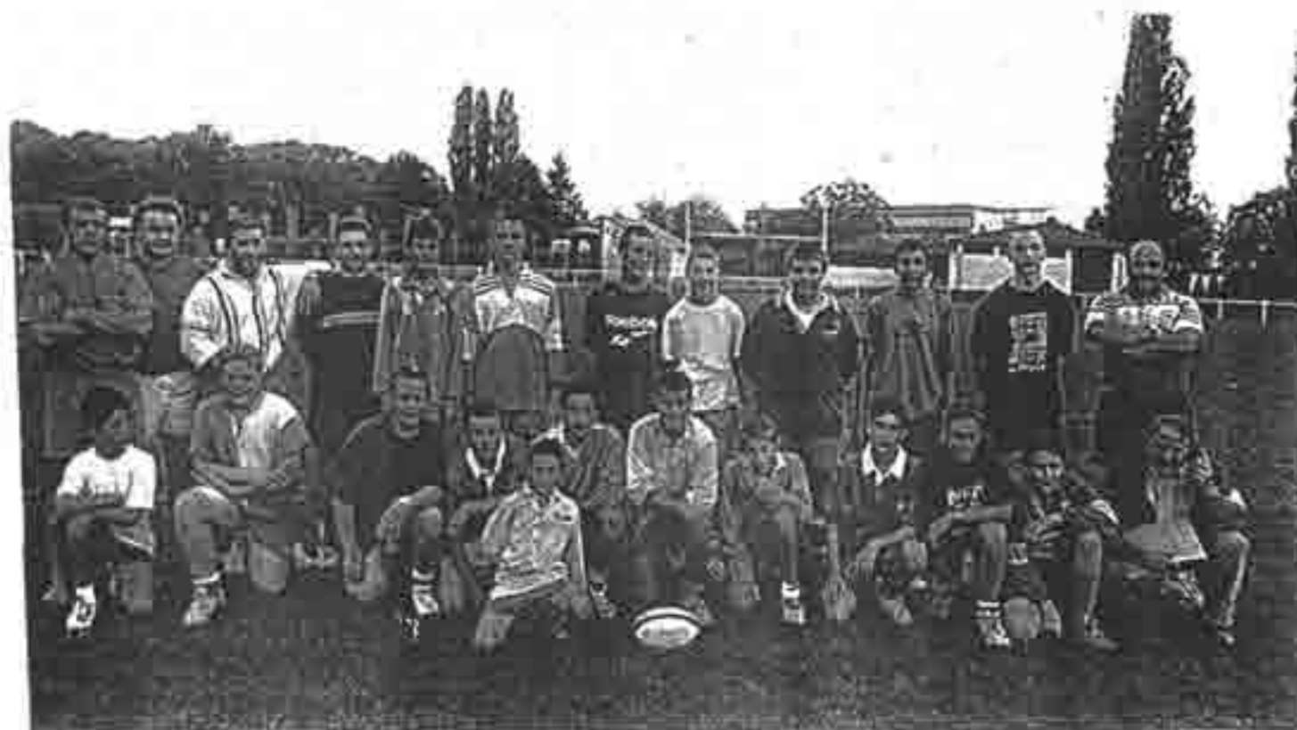
Les cadets ont eux aussi repris le chemin du stade