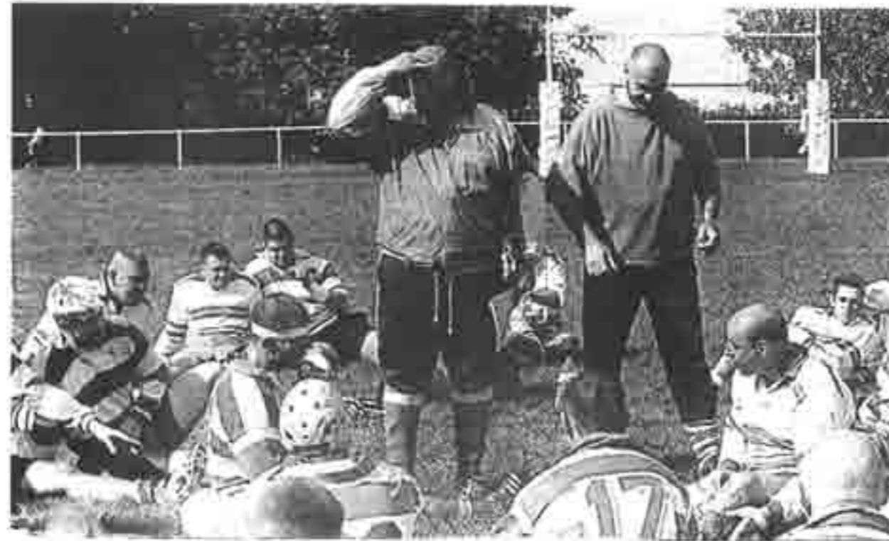
Le nouvel entraîneur veut regarder loin