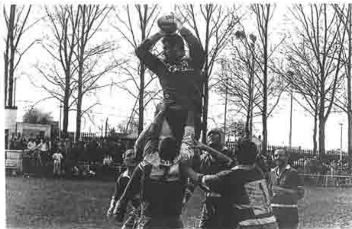
La touche a fonctionné de belle manière pour une équipe de Lagny conquérante