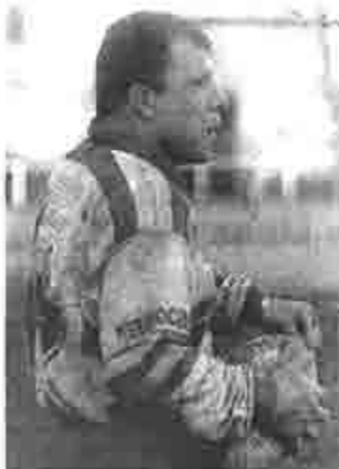
Dinu, un grand match

« Nous avons commencé à trouver une équipe dans les deux derniers matches. Là, nous avons pris d'entrée notre adversaire à la gorge. Il n'y a rien à dire même si la victoire aurait pu être plus conséquente sans un arbitrage un peu en faveur des locaux »