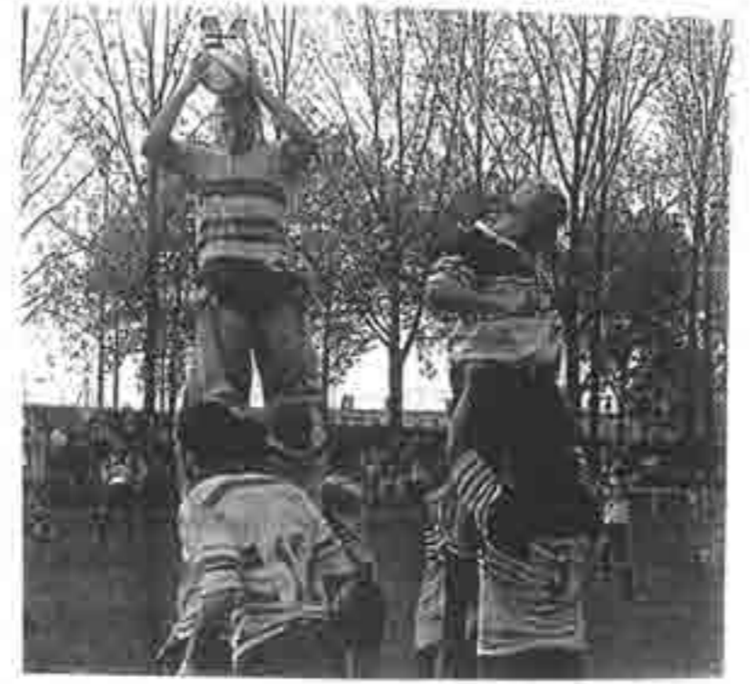
Jolie prise sans opposition

minutes. On a joué dans la continuité et il y a du mieux en défense. Nous sommes perfectibles mais nous confondons toujours vitesse et précipitation » concède Jean Miss, Des propos confirmés par Ludovic Baron : « La première ligne a tenu le choc. Nous sommes également mieux disciplinés mais il reste du travail à faire dans la liaison. On va aller en s'améliorant » Pour l'instant, le spectateur fidèle est comme satur Anne. Il ne voit rien venir. Peu de jeu, peu d'ardeur de la part des acteurs qui vont devoir passer la vitesse supérieure en montant en pression. Dimanche il va falloir confirmer à Rueil. Et si le moment était venu de prendre les points à l'extérieur ? Pascal PLOPPY